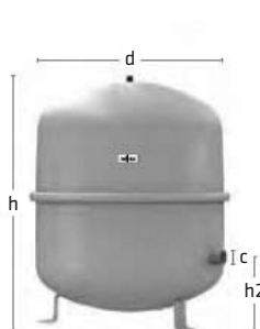
N 35 - 140 Liter

Při porušení podmínek Návodu k montáži a provozu hradí škodu montážní firma nebo provozovatel. pozn. Další informace viz záruční podmínky Reflex na webových stránkách.