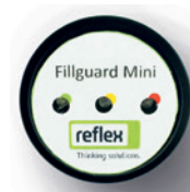
Reflex Fillguard Mini

Reflex CZ, s.r.o., Sezemická 2757/2, 193 00 Praha 9, tel.: 272 090 311 reflex@reflexcz.cz , www.reflexcz.cz