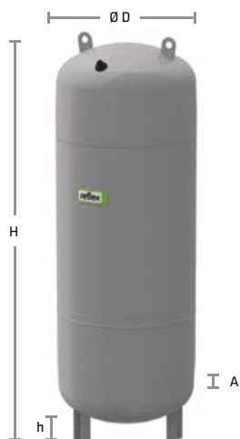
SlimLine 180–320 litrů